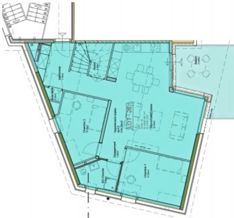
LOT 26 - Duplex 4p1/2 126.10m 2 - surface pondérée