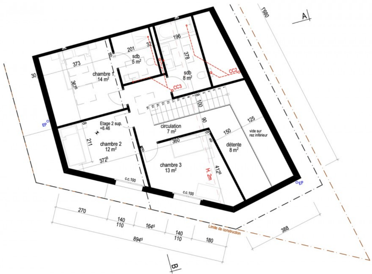
Appartement D - 2ème étage