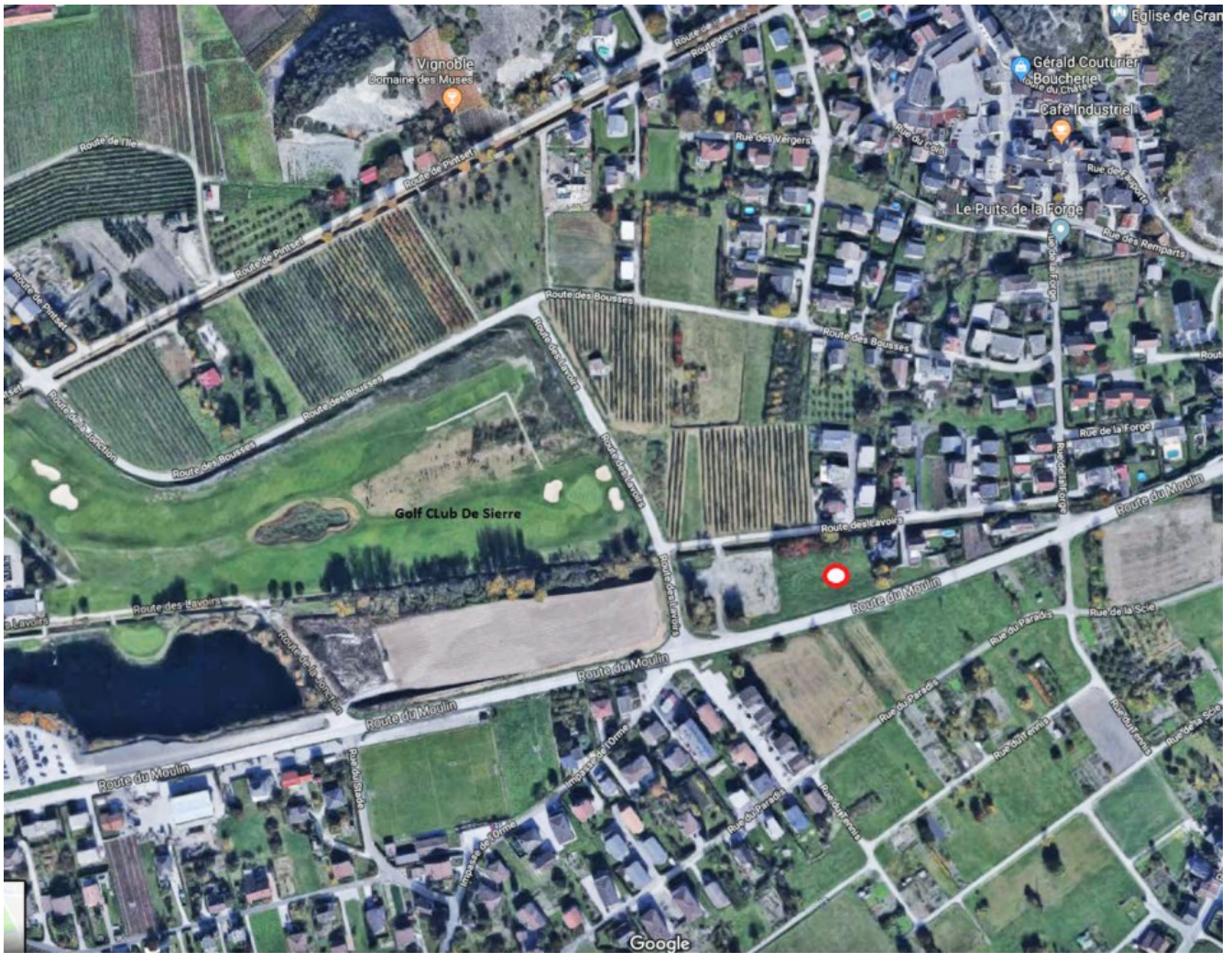
Route des Lavoirs - 3977 Granges/Sierre